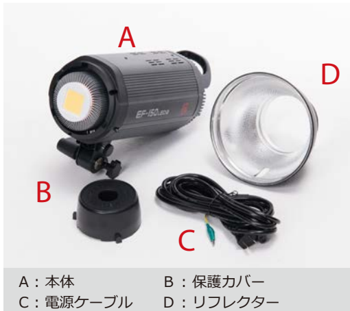
A : 本体 B : 保護カバー C : 電源ケーブル D : リフレクター